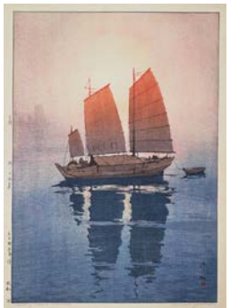
①特に水の描写が優れていると評されている(瀬戸内海集 帆船 朝)

日本とハワイの歴史・伝統を発信する文化交流イベント。ロコモコ、マラサダなどのハワイらしいフードが味わえるブースや、ハワイアングッズの販売、ワークショップを展開する。そのほか注目は、4つのステージで行われるライブやダンス。日本の和太鼓からハワイのフラまで、約100セッションを予定している。