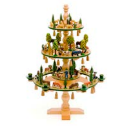
①一つ一つ丁寧に手作りされた木製の動物がのったキュートなツリー

木製おもちゃの魅力を紹介する展覧会。ドイツ・エルトツ地方の伝統的な技術で作られたおもちゃを中心に、積木やパズル、クラフト玩具約450点を展観する。さらに、展示品と同種のおもちゃで遊べるプレイコーナーも登場!