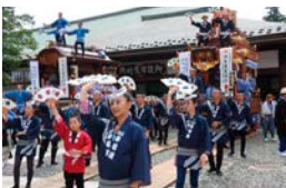
①各町による踊りの奉納(総踊り)

明治から昭和にかけて海外でも活躍し、風景画の実力者として、ダイアナ妃や精神医学者・フロイトも魅了した洋画家・吉田博。そんな日本近代美術史に名を刻む彼の、生誕140年を記念した回顧展が開かれる。今回は、仲間から“絵の鬼”と称されるほど鍛錬を積んだ彼の風景画を200余点紹介。なお、会期中は展示替えあり。