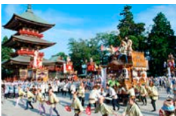
②大本堂前に全員が集まる(総踊り)

国千葉県成田市成田1(成田山新勝寺)ほか ☎0476-22-2111 7/7(金)13:30~21:00ごろ、8(土)9:00~、9(日)13:00~ 国観覧無料 国①成田駅、②京成成田駅より徒歩10分