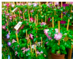
①入谷のアサガオは江戸時代から栽培され、明治の中ごろにはその見事なできばえで有名になったという

サラダ記念日 今日は 何の日? 1987年に発売し、大ヒットした俵万智による歌集「サラダ記念日」のなかの短歌にちなむ。