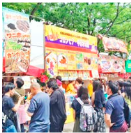
①ペルー料理を片手にラテン音楽のライブを楽しもう※イメージ

ペルーのグルメや音楽、文化などが体験できる異文化交流フェス。牛肉とフライドポテトを組み合わせた「ロモ・サルタド」や、白身魚やタコを使用したマリネ「セビチエ」など、本場の味がそろった。ステージでは、サルサダンスなども展開。