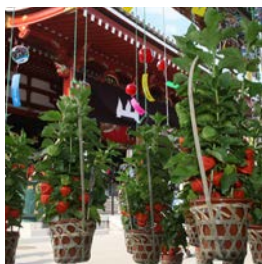
①真っ赤に色付いたホオズキが並び様子は夏の訪れを感じさせる

浅草の夏の風物詩。境内には、約100軒のホオズキの露店が軒をつらね、威勢のいい売り子のかけ声が市を盛り上げる。「7/10」にお参りすると、46,000日間参拝したのと同等のご利益があるとされ、毎年多くの参拝客が訪れる。