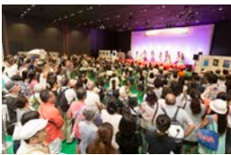
①ハワイから来日するゲストも多数