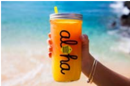
②フワフワレモネードも登場

国中央区日本橋2-7-1 東京日本橋 タワーB2~1F ☎045-680-2899 7/7(金)15:00~21:00、8(土)・9(日) 10:00~18:00 国入場料¥1,000 国②③日本橋駅B6出口直結