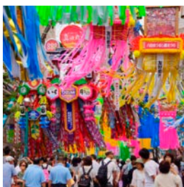
①高さ10mを超える七夕飾りや色とりどりの短冊をつらねた竹は見応え抜群

湘南スターモール商店街を中心に、絢爛豪華な七夕飾りが街を彩る。7/7(金)の「七夕おどり千人パレード」では、カラフルな衣装の踊り子たちが飾りの下をパレードする。期間中は、地元グルメが集まる「七夕 たからいちグランプリ2017」も実施。