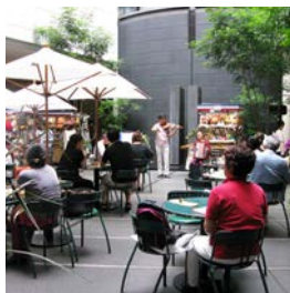
①ドゥマゴパリのテラスを中心に29のショップが登場(前後期入替制)

7/14(金)のフランス革命記念日にパリで行われる「パリ祭」にちなんで開催。期間中は、Bunkamura内でバイオリンとアコーディオンの生演奏や名優アラン・ドロン映画上映のほか、限定特別メニューなども味わえる。